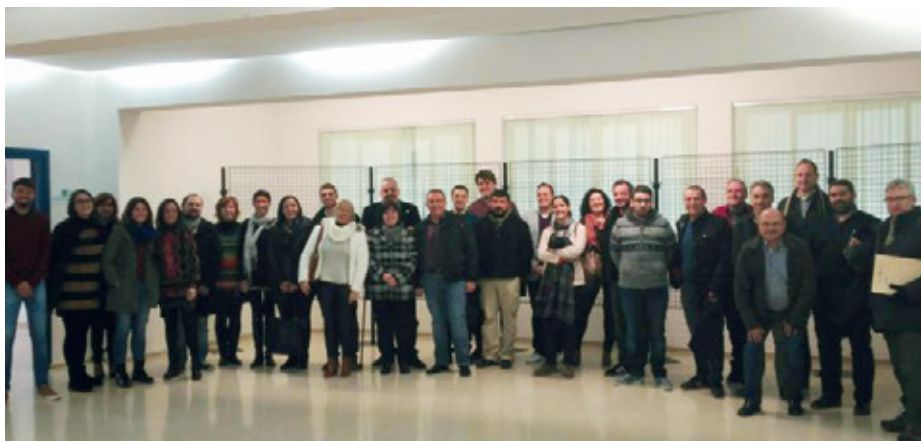
25 gener. Dènia. Constitució del Consell Rector de la Xarxa de Joves Marina Alta . MACMA

Aquest últim any la comarca ha iniciat uns canvis en matèria de joventut que ens han portat a que en passats plenaris s'aprovara la modificació dels Estatuts de la MACMA, per a la inclusió de la Xarxa de Joves de la Marina, procediment que hauran de portar a terme tots els pobles que hi formen part d'ella. Es tracta de dotar d'una cobertura supramunicipal a la Xarxa que ja venia actuant ens els últims temps d'una manera prou activa i que d'aquesta manera tindrà el reconeixement que li faltava a l'àrea de joventut. El 25 de gener a la Casa de Cultura de Dènia, es va convocar en sessió extraordinària a tots el pobles membres de la MACMA, en aquest cas no assistien els regidors de cultura, eren convocats els de joventut, i és que el tema a tractar era una assumpte de gran importància per a tot el jovent de la comarca : La Xarxa de Joves de la Marina Alta, i la creació del seu Consell Rector. Finalment en aquest acte es va constituir el consell rector que s'integrarà dins de l'òrgan comarcal per tal de tractar i representar a tota la joventut del nostre i dels pobles veïns. Aquesta és la culminació d'un treball en el qual s'han involucrat els regidors de joventut de tota la marina, i amb uns tècnics que sovint s'impliquen personalment, fruit d'aquesta situació hui podem